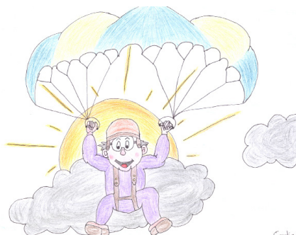
Dessin de Coralie Reuse, Sembrancher