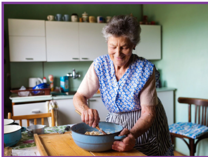
Grandmas project : les recettes de grands-mères du monde entier à l'honneur

A prendre : tablier, gourde, collation, tupperware.