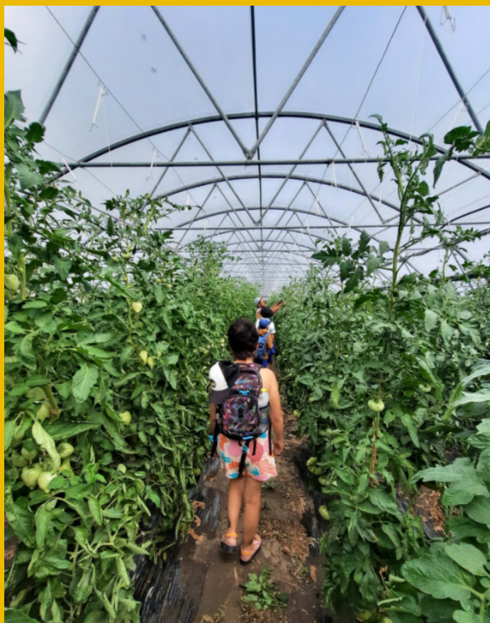
Visite du domaine Dussex à Saillon

Autre: Si tu possèdes le Pass St-Bernard, merci de le prendre avec toi pour cette journée. Vous devez savoir nager ou prendre vos manchon.