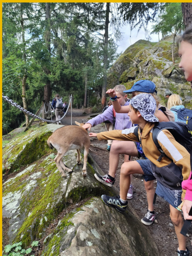
Zoo des Marécottes, PVAC 2025