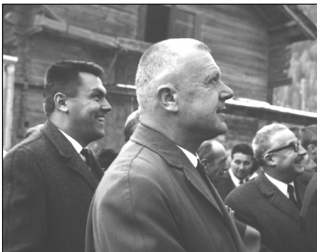
Photo du haut: bénédiction de l'alpage de Mille, Bagnes, juin 1967