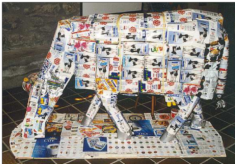
Ci-dessous. Sculpture de vache réalisée avec des emballages contenant des produits laitiers. Cette réalisation a pris le chemin des Musées Cantonaux à Sion où elle est présentée aux visiteurs à l'entrée du Musée de Valère (6P de Salvan)