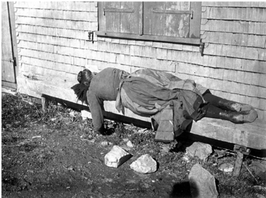
Photo tirée de Charles Krebsler, de Jean-Henry Papilloud, Monographic, Sierre 1987

Dans ce chapitre, nous mettons l'accent non pas sur le processus biologique du rêve (période du sommeil, intensité du cerveau... – sujets scientifiquement étudiés) ni sur une interprétation de type psychanalytique, mais bien sur la perception qu'en ont l'enfant et l'adulte. C'est pourquoi, le travail effectué dans ce cadre peut engendrer des créations sous forme illustrée (dessins, peintures, bricolages, rédactions, poèmes...).