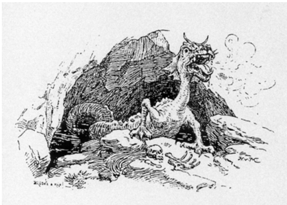
Gravure tirée de Les veillées des mayens , de Louis Courthion, A la Carte, Sierre, 1996 (réédition)

Imagine un conte dont le personnage appartient à tes rêves/cauchemars.